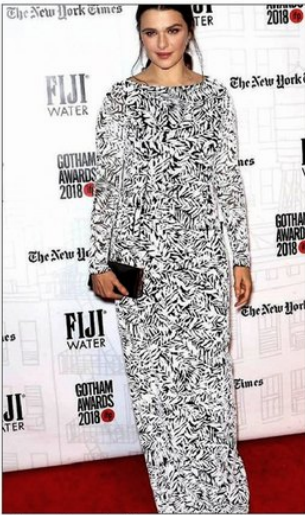
El modelo es de Michael Kors.